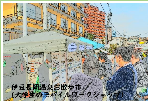
伊豆長岡温泉お散歩市 (大学生のモバイルワークショップ)