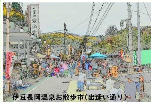
伊豆長岡温泉お散歩市(出逢い通り)