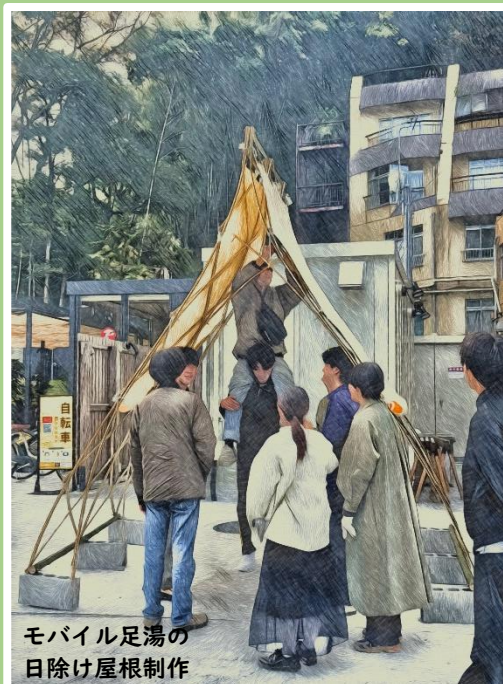
モバイル足湯の 日除け屋根制作