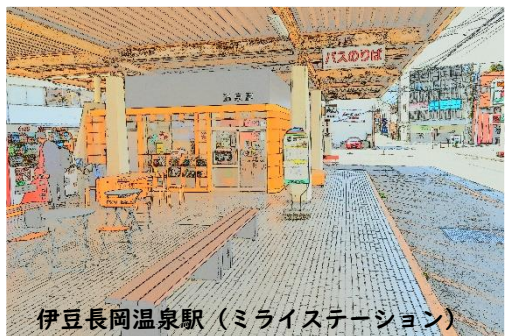
伊豆長岡温泉駅 (ミライステーション)