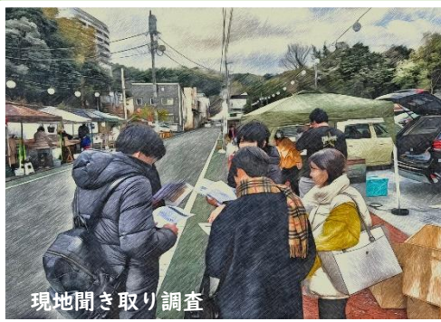
現地聞き取り調査

今回は、外に出たくなる・歩きたくなるまちを目指して、現地に出向いて聞き取り調査などを行った成果を発表します。また、今後のさらなる伊豆長岡地域の新たな可能性についてご提案します。