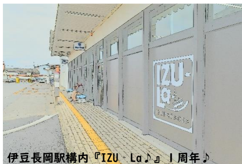
伊豆長岡駅構内『IZU-La』1周年