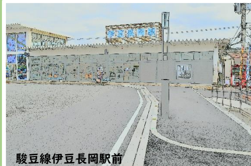
駿豆線伊豆長岡駅前