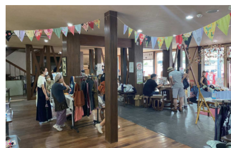
南山荘での賑わいある活動