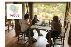
2020.06伊豆の国市と伊豆市を中心に展開している3世代ふれあいサークル「coco」。温泉場お散歩市の会場である南山荘で始まった【ココブコ】は、図書館や本屋さんが無い伊豆長岡地区で、簡易図書館の役割をしている。