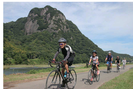
伊豆長岡の自然を楽しむ E-BIKE 周遊