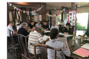
2019.06伊豆の国市観光地エリア景観計画策定に向け地域景観ミーティングがスタート。地域住民や事業者等と各エリアについての議論を重ねた。