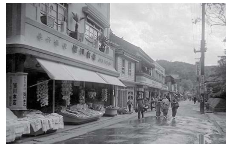
昔の温泉場通りの様子

また伊豆ベロドロームでのオリンピック・パラリンピックの室内自転車競技の開催を契機に、市内の道の駅伊豆のへそに隣接する自転車ブランド MERIDA の世界最大規模の展示・試乗施設「MERIDA X-BASE」を拠点の一つとし、地域の新たなプレイヤーであるメリダジャパン・ミヤタサイクル他サイクリストのニーズをふまえ、温泉 × 健康・福祉 × 自転車を活かした周遊プログラムを策定し、温泉場が起点となり市内の歴史的な史跡や地域ならではのグルメ、自然アクティビティを楽しめる拠点づくりとしてのまちづくりを進めていきます。