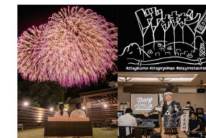
2020.08花火をライブ配信「ドオオン伊豆の国」。花火だけでなく、伊豆の国にまつわる様々なコンテンツをYouTube LIVEにて配信。密を回避し、新しい生活様式に配慮した花火大会を実施した。