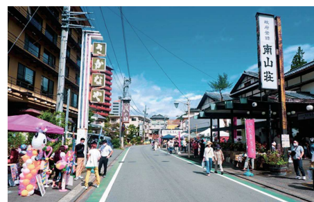
現在の温泉場お散歩市の様子