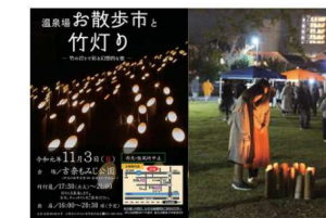
2019.11古奈湯温泉に整備された「古奈もみじ公園」の芝生広場を使い、竹灯籠とお散歩市のコラボイベントを初開催した。