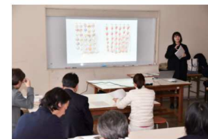
2020.01ふじのくに地域・大学コンソーシアムゼミ生等地域貢献推進事業で伊豆長岡温泉の活性化をテーマに大学生が調査企画案を行った。