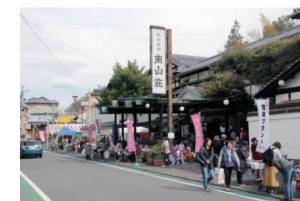
2017.12伊豆長岡温泉お散歩市の会場として、休館中の南山荘内を活用開始(月1回、現在まで)。地元の海の幸、山の幸、果物、季節の野菜の販売、飲食店も出店するマルシェ（イベント市場）。